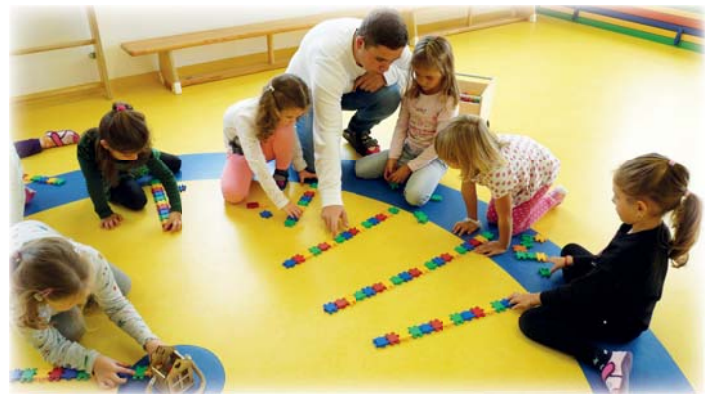
Reihenfolge-Muster erkennen, fortsetzen