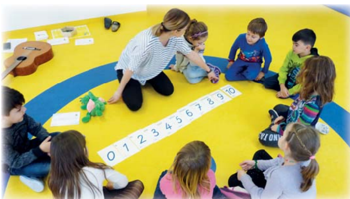
Mengen vergleichen und verändern