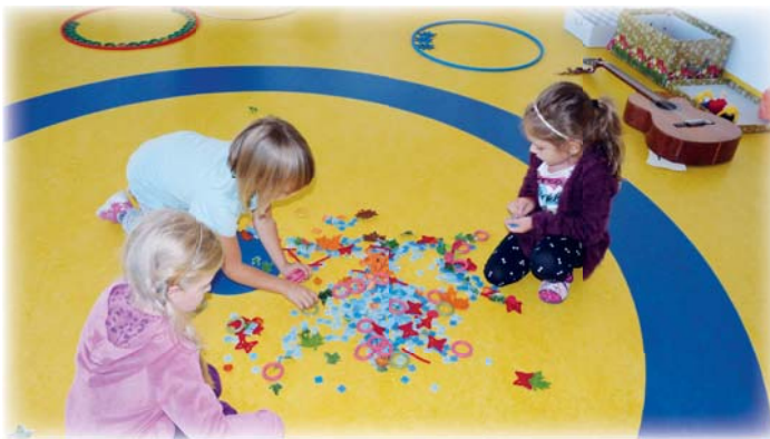
Ordnen und Sortieren

Der kleine Drache Baldur ist auf dem Weg die Lehre der Mathematik zu entdecken und will genau wie die Kinder, alles über Zahlen wissen. Der Zahlenzauberkönig ist der Zahlenmeister, Experte sowie Ratgeber in der Welt der Zahlen und regt die Kinder zum Nachdenken an. Er hält Hilfen und Tricks im Umgang mit Zahlen und Mengen für die Kinder bereit.